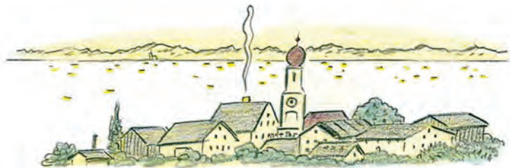
DÖRFER WIE IN ALTEN ZEITEN