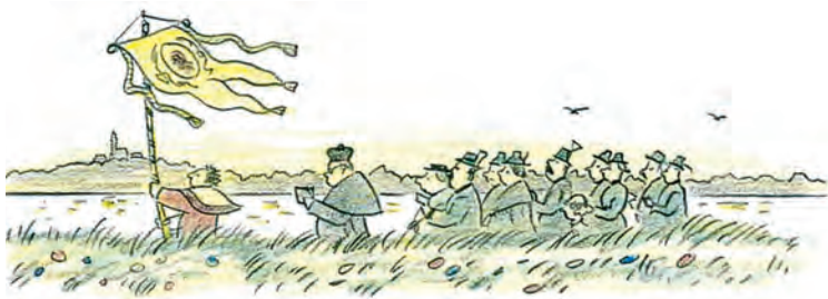
PILGER, DIE DURCH WIESEN SCHREITEN